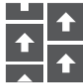
Half Drop / Ashlar

Yli 6 metrin pituisille alueille on suositeltavaa jakaa asennuksessa oleva alue samansuuruisiksi, noin 3 m kokoisiksi, ja liimata alla olevien ohjeiden mukaisesti X-kuviotapaa -käyttäen.