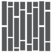
Plank: Parallel Random

Vinyylilattia asennetaan huoneen pidemmän sivun suuntaisesti. Mikäli huoneessa on suuria ikkunoita, asenna kohtisuoraan ikkunan suuntaisesti. Asennustavat ovat seuraavat, varmista soveltuvat asennustavat kohteeseen toimitetusta lattianpäällystelaatikosta.