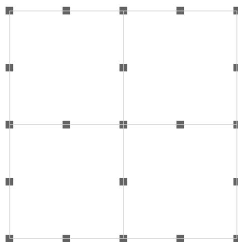
Asennusohje 96 x 96