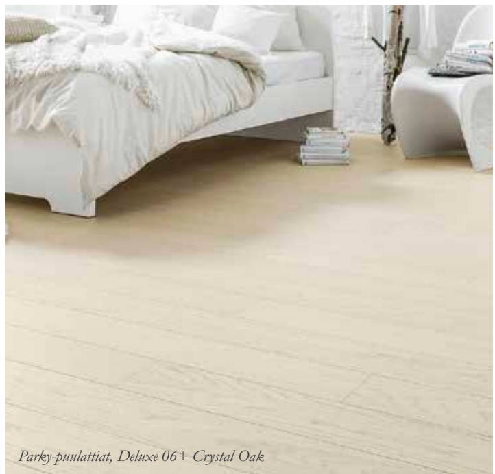
Parky-puulattiat, Deluxe 06+ Crystal Oak

Parky-puulattiat sopivat monelle. Voit valita puulajitelmista omaa sisustusmakua tukevan version: joko oksattoman ja tasavärisen tai eläväisemmät värivaibtelut sekä isot ja pienet oksat.