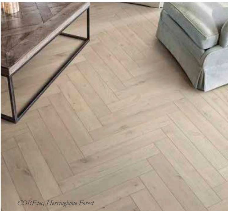
COREtec, Herringbone Forest

COREtecille on myönnetty M1-sisäilmasertifikaatti osoituksena puhtaasta sisäilman tukemisesta ja vähäpäästöisyydestä. Lue lisää COREtecista sivulta 16.