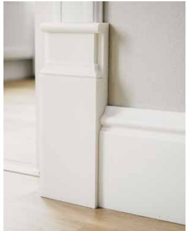
Näyttävät, korkeat jalkalistat voidaan asentaa myös vanhojen listojen päälle, kuten kuvassa.