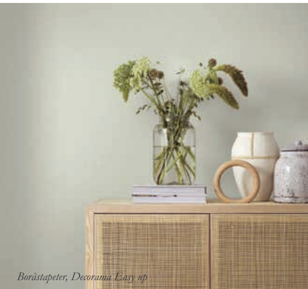
Boråstapeter, Decorama Easy up