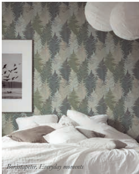
Boråstapeter, Everyday moments