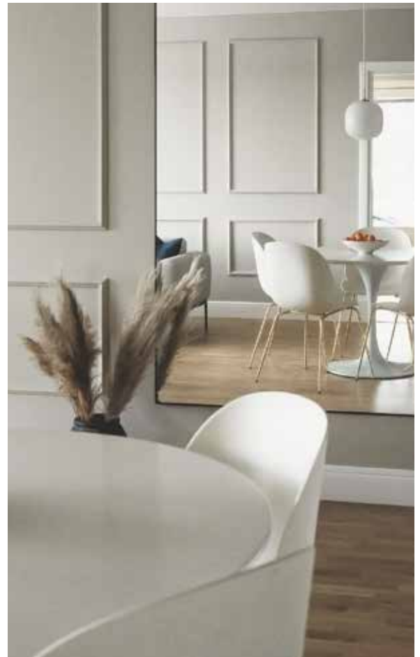
Inspiraatiota tosielämästä: valkoiset seinät kokivat muodonmuutoksen Orac Decor -koristelistoilla. Lopputuloksena syntyi kaunis ja harmoninen kokonaisuus. Aikaa noin 100-neliöisen asunnon remontoimiseen meni vain noin kolme päivää.