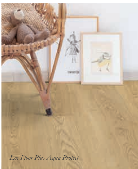
Loc Floor Plus Aqua Protect