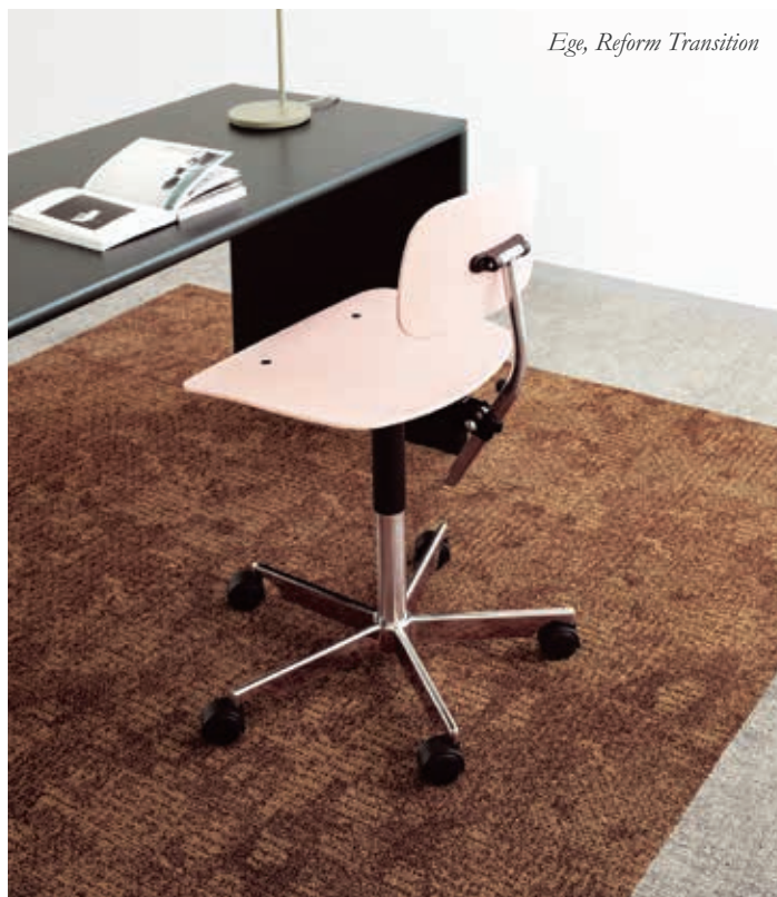
Ege, Reform Transition

Pehmeä astella, hyvä sisäilmalle – tekstiilimatot ja mattolaatat mullistavat pölyttyneet käsitykset kokolattiamatoista.