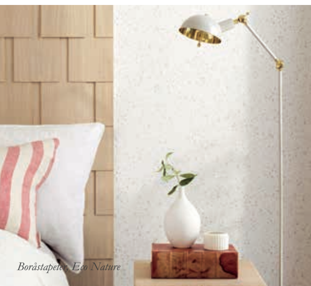
Boråstapeter, Eco Nature